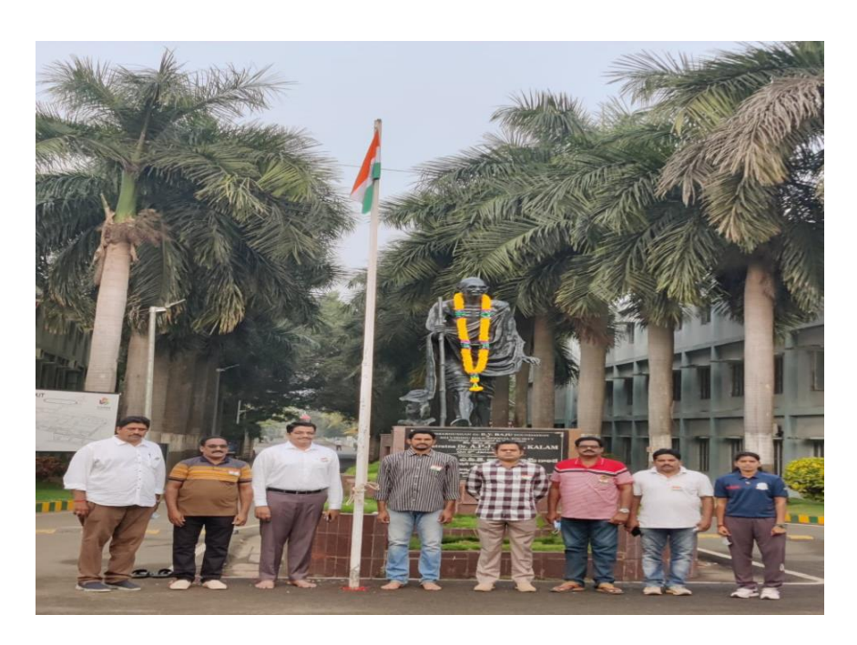
8.Mega Blood Donation Camp